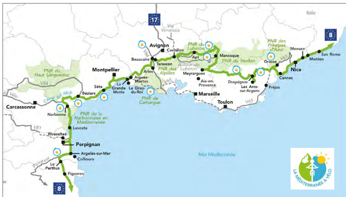
Carte de La Méditerranée à vélo